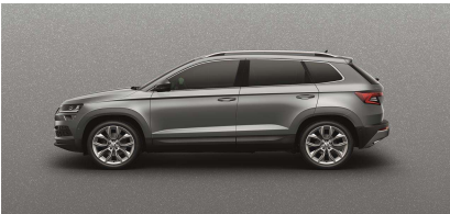
Gris Business (2C2C)