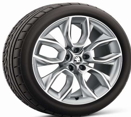
Llanta de aleación CRATER 19"