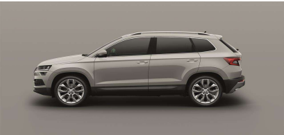
Gris Metal (M3M3)