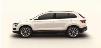
Blanco Candy (9P9P)