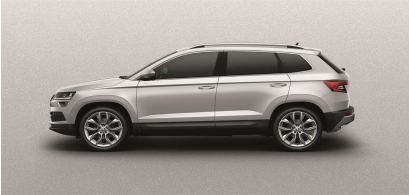
Plata Brillante (8E8E)