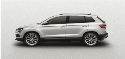
Blanco Luna (2Y2Y)