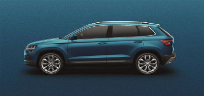
Azul Lava (0F0F)