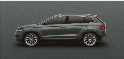
Gris Cuarzo (F6F6)