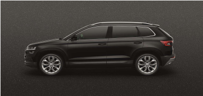
Negro Mágico (1Z1Z)