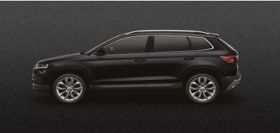
Negro Cristal (6J6J)