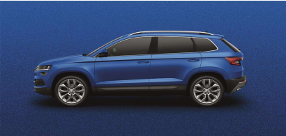
Azul Race (8X8X)