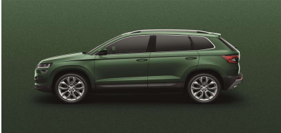
Verde Esmeralda (2A2A)