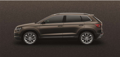
Marrón Magnético (0J0J)