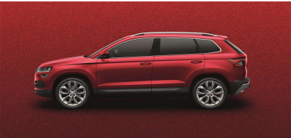
Rojo Velvet (K1K1)