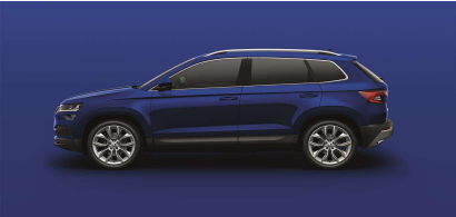
Azul Energy (K4K4)