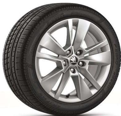
Llanta de aleación TRITÓN 17"