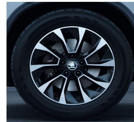
Llanta de aleación ARONIA 17"