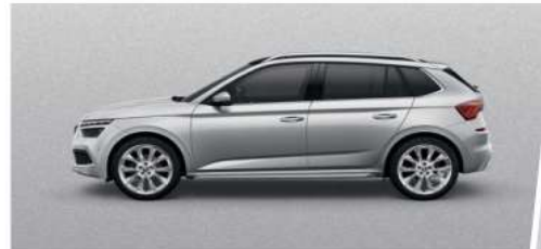
Plata Brillante (8E8E)