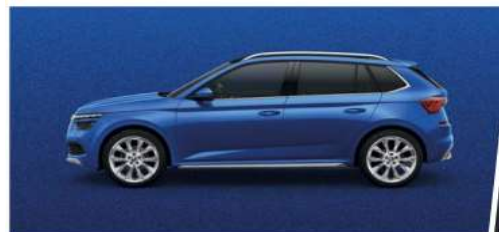
Azul Race (8X8X)