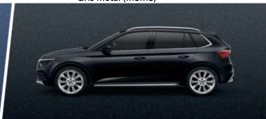
Negro Cristal (6J6J)