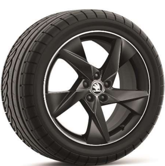
Llanta de aleación VOLANS 17" Serie en Monte Carlo