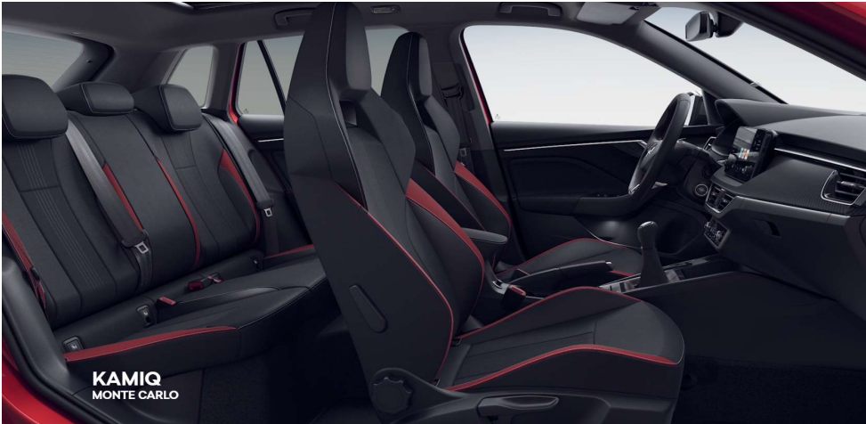
Monte Carlo Rojo