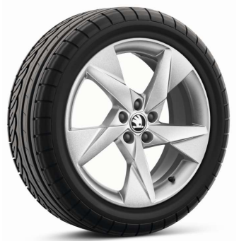
Llanta de aleación VOLANS 17"