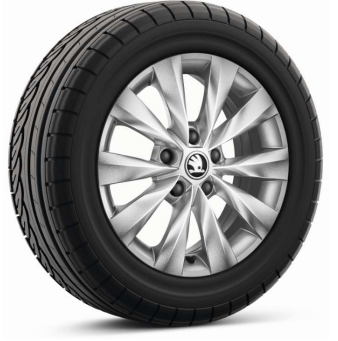
Llanta de aleación CASTOR 16"