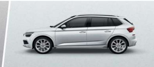
Blanco Luna (2Y2Y)