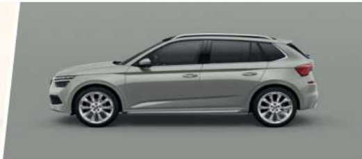
Gris Metal (M3M3)