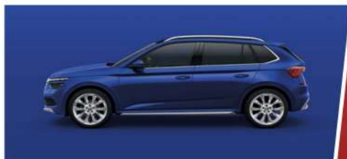
Azul Energy (K4K4)