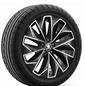
Llanta de aleación PROPUS AERO 17" Serie en Sport