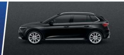
Negro Mágico Efecto Perla (1Z1Z)