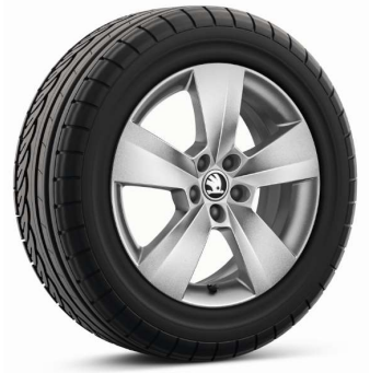
Llanta de aleación ORION 16" Serie en Ambition/Ambition Plus