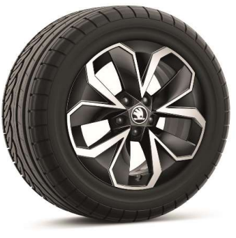
Llanta de aleación HOEDUS "AERO" 16"