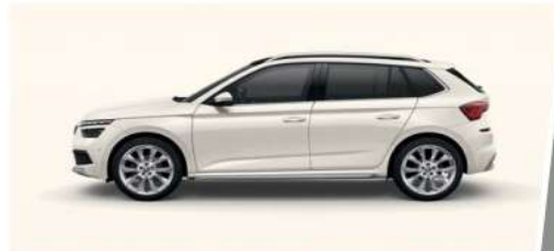
Blanco Candy (9P9P)