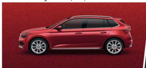
Rojo Velvet (K1K1)