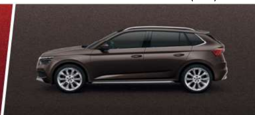
Marrón Maple (Q4Q4)