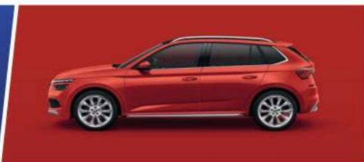
Rojo Fuego (8T8T)