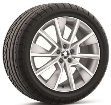
Llanta de aleación BRAGA 17"