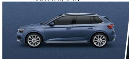
Azul Titán (9F9F)