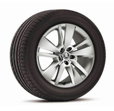
Llanta de aleación ARONIA 19"