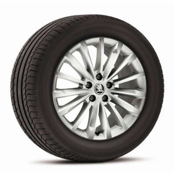
Llanta de aleación VEGA 20"