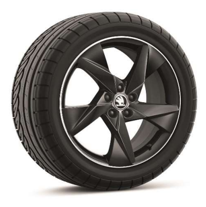
Llanta de aleación VEGA AERO 18" en negro

Llanta de aleación VOLANS 17" en negro Serie en Monte Carlo